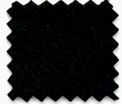
CS VELVET PRO 300 - 48