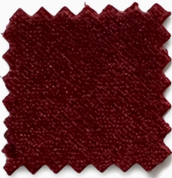
CS VELVET PRO 300 -1570