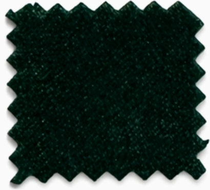
CS VELVET PRO 300 - 400