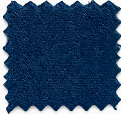
CS VELVET PRO 300 - 410