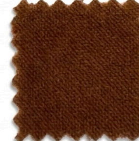
CS VELVET PRO 300 - 232