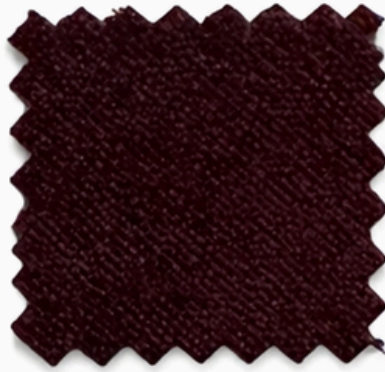
CS VELVET PRO 300 - 24