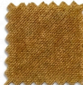
CS VELVET PRO 300 - 218