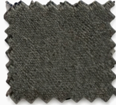
CS VELVET PRO 300 - 1965