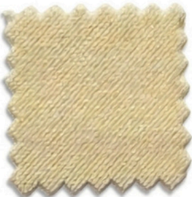
CS VELVET PRO 300 - 1