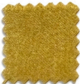
CS VELVET PRO 300 - 464