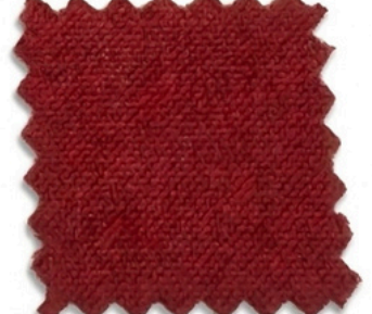
CS VELVET PRO 300 - 412