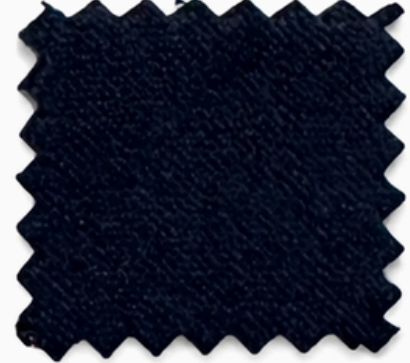
CS VELVET PRO 300 -1966