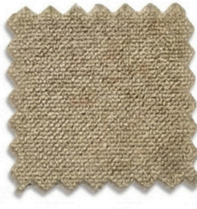
CS VELVET PRO 300 -149