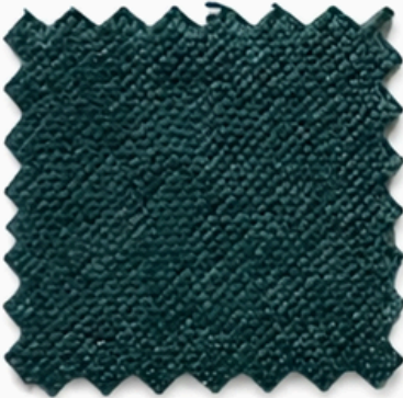
CS VELVET PRO 300 - 1636