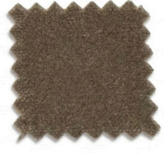
CS VELVET PRO 300 - 1564